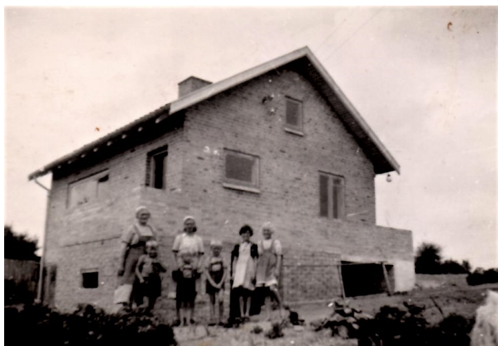
Lyngvej 3 - 1950

Efter at have gravet en brønd, begyndte husbyggeriet på Lyngvej 3. Først med en kælder, som blev udgravet med håndkraft, hvor hele familien flyttede ind, da dækket havde fået en gang asfalt, så kælderen var vandtæt. Efterhånden som pengene rakte, blev der bygget videre på stueetagen, hvor vi efter et par år flyttede ind.