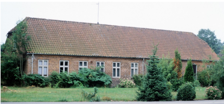
Den gamle skolebygning - nordsiden ud mod Julsøvej - fotograferet kort før nedrivningen.

I den gamle skole, som lå langs Julsøvej, hvor Enebærparken nu ligger, var der klasselokale i halvdelen af længens østlige del. I den anden del mod vest var der lærebolig. Fra skolebygningen og ud mod vejen, var der skolegård afgrænset med stakit. Langs med bygningens fulde længde var der lagt piksten, hvor lærerne gik gårdvagt. Fra den østlige ende, ved indgangsdøren hvor man kom ind i gangen, var der en dør ind til hver side i klasselokalet.