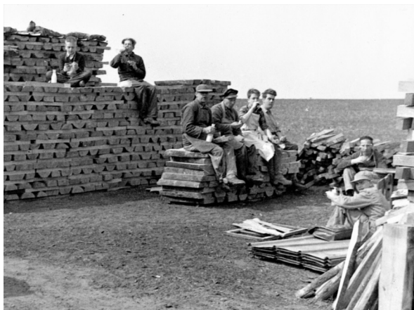
Frokostpause på Svejbæk Bøjlefabrik

Dengang var Arbejdstilsynets regler endnu ikke nået helt til Jylland. De sanitære installationer var ikke som nutidens, hvor der kræves både toilet, badefaciliteter og frokostlokale. Skulle man forrette sin nødtørft, skete det på et gammeldags lokum, det vil sige en spand under et bræt, man kunne sidde på. Et frokostlokale eksisterede heller ikke. Madpakken blev indtaget udendørs eller på værkstedet, hvor man holdt en halv times pause.