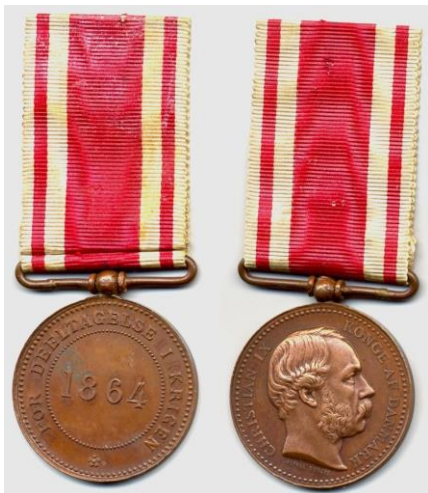
Erindringsmedalje for deltagelse i krigen 1864

Jeg har undret mig over, at jeg ikke har fundet oplysning om en Erindrings-medalje for ham fra krigen i 1864, som alle krigsdeltagere kunne ansøge om at få. Jeg har undersøgt de steder, han har været omkring ansøgningstidspunktet for medaljerne, som er 1876. Oplysningerne findes på nettet, herredsvist. Men jeg har ikke fundet ham. Der var omkring 58.000 som fik denne medalje. Så med oplysningen fra kirkebogen, ”soldat fra 1864”, burde han have haft en sådan medalje. Og han kunne vel også have fortalt krigsoplevelser. Han var en fortæller.