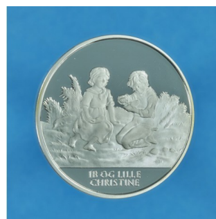
Ib og Christine-mønt