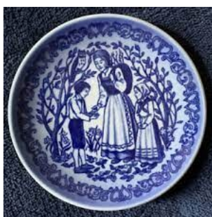
Ib og Christine-platte