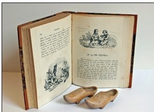
Jens' egenhændigt skårne træsko