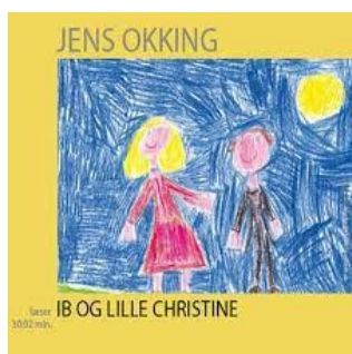
Omslag til CD

Skuespilleren Jens Okking indtalte hele fortællingen (kan findes på YouTube). Den kongelige Porcelænsfabrik fremstillede en platte med motiv fra fortællingen, og der blev præget en mønt med H.C. Andersen på den ene side og Ib og lille Christine på den anden.