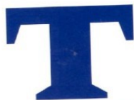
Rederiet Torms vartegn