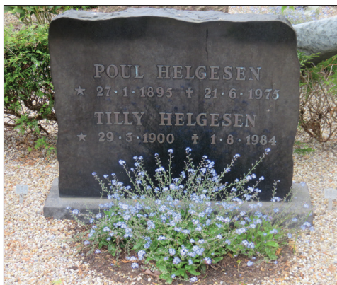
Elisabeths gode venner. Blåvand Kirkegård.

fik hun problemer med at gå. Hun kom derfor på plejehjem i Blåvand. Antagelig var denne chokerende oplevelse med til at forkorte hendes liv.