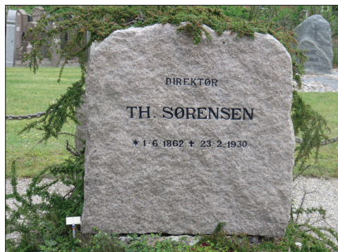
Gravstenen på Blåvand Kirkegård.