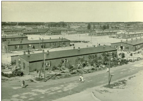
Oksbøllejren 1945 – 1949.