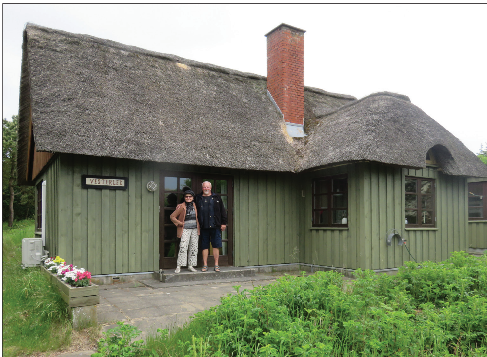
Sommerhuset "Vesterled" (som hun arvede) ved Blåvand Fyr.

nordmand, hendes far var tysker, men var rejst til Norge som voksen. Hvis det sproglige kneb, kunne de altid betjene sig af tysk som fællessprog.