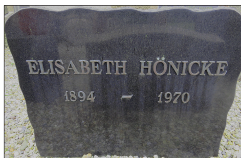
Gravsten på Blåvand Kirkegård (Foto forfatteren).

Da hun fyldte 75 år, holdt skøjteklubben en opvisning, hvor hun deltog. Desværre faldt Elisabeth og kom slemt til skade, bl.a.