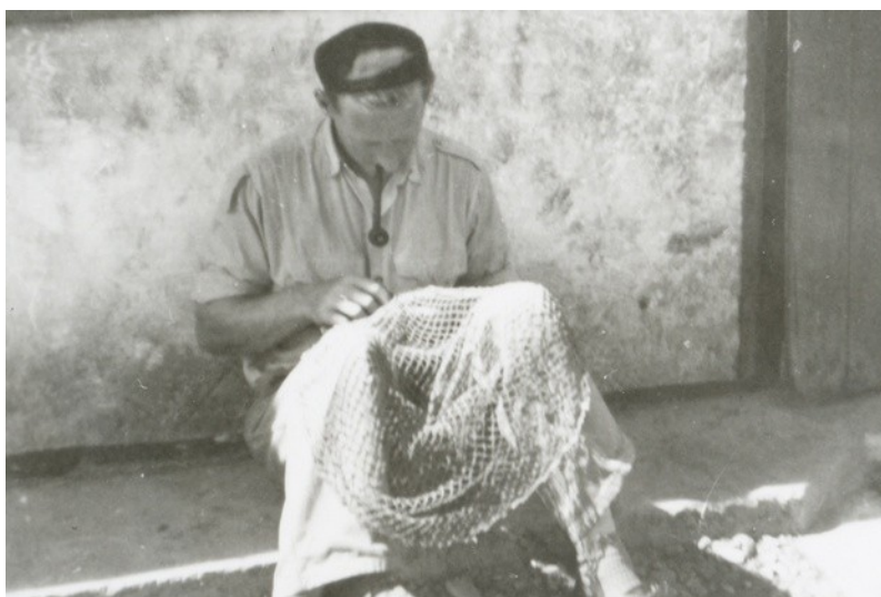
Åleruse knyttes. 1959