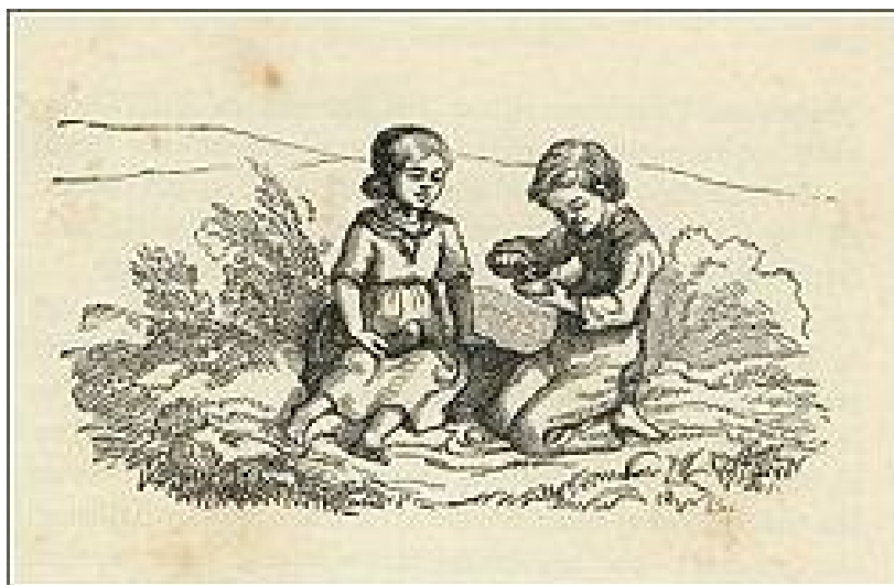
Ib og lille Christine siddende på Sejs Hede

Det er en fin lille fortælling – typisk H.C. Andersen – om Jeppe-Jæns, der drev sit lille husmandssted inde i skoven og som om vinteren var en flittig træskomand. På dette husmandssted bor sønnen lille Ib. Prammanden, som boede i lyngtørvshuset på Sejs Hede, havde datteren lille Christine. De to jævnaldrende børn havde stor glæde af hinandens selskab.