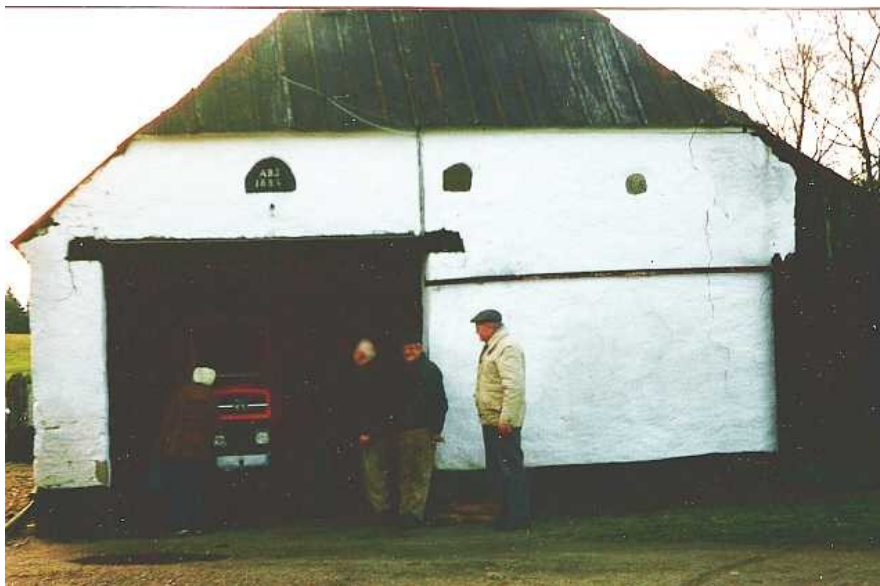
Her kan man se stenene indmuret i gavlen på Bjørnholt 1989