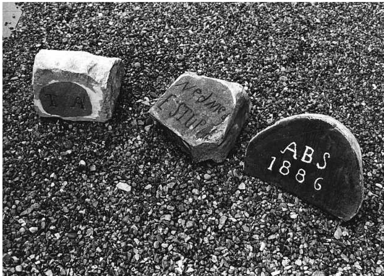
Stenene på Bjørnholt

Han byggede sin gård i fire længer: stuehuset i palæstil samt to længer stald og en lade. I gavlen til laden murede han en stor flad sten ind, i hvilken han havde ristet nogle runer over diktatoren Estrup: ”Ned med E’strup”.